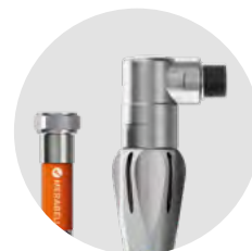
M0025 Plynová hadice GAS Profi s ventilem G1/2"– bajonet, délka 100 cm

Součástí rekonstrukce pece byla mimo jiné výměna bočních předhořáků a vysokorychlostních hořáků včetně přípojovacích hadic, které přivádí do pece plyn. Na původních pryžových hadicích byl již znát mnohaletý provoz v náročných podmínkách. Povrch hadic byl narušen korozí a hadicovina byla vytržena z koncovek. Došlo tak k odhalení samotného gumového vnitřku hadice, který byl již ztřeštělý a hrozil tak únik plynu. Tento typ gumových hadic pro přívod plynu již nesplňuje aktuální evropské povinné normy.