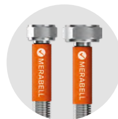
Hadice Merabell Aqua, toaletní, G3/8"–G1/2"