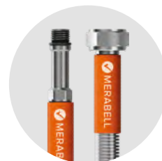
Hadice Merabell Aqua, vodovodní baterie, G3/8"–M10x1 dlouhý závit

„Majitel bytu si na radu instalatéra postupně nechává vyměnit veškeré hadičky v bytě za nerezové hadičky. Bohužel ne každý má stejný přístup k této problematice a nechá si vyměnit hadičky v bytě. Náklady na 1 bytovou jednotku jsou zhruba 3 500 Kč“, uzavírá pan Laňka.