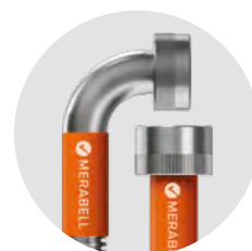
Hadice Merabell Aqua, pračková, G3/4"–G3/4"